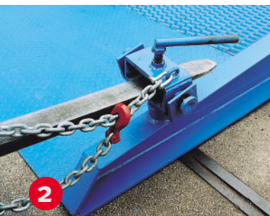
Зажим для погрузчика