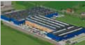
Hörmann KG Werne, Deutschland