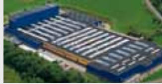
Hörmann KG Freisen, Deutschland