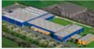
Hörmann KG Antriebstechnik, Deutschland