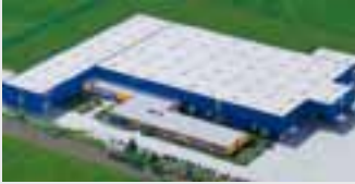
Hörmann KG Dissen, Deutschland