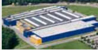
Hörmann KG Eckelhausen, Deutschland