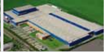
Hörmann KG Ichtshausen, Deutschland