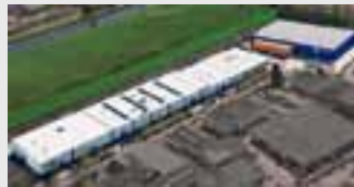
Hörmann Alkmaar B.V., Niederlande