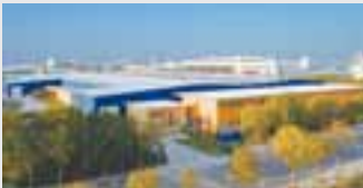
Hörmann Beijing, China