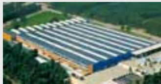
Hörmann Genk NV, Belgien