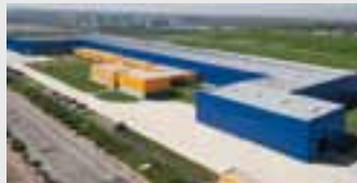
Hörmann Tianjin, China