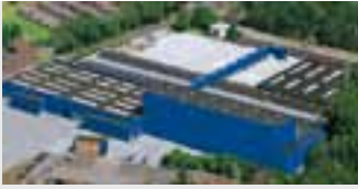
Hörmann KG Amshausen, Deutschland