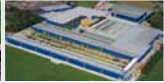
Hörmann KG Brockhagen, Deutschland