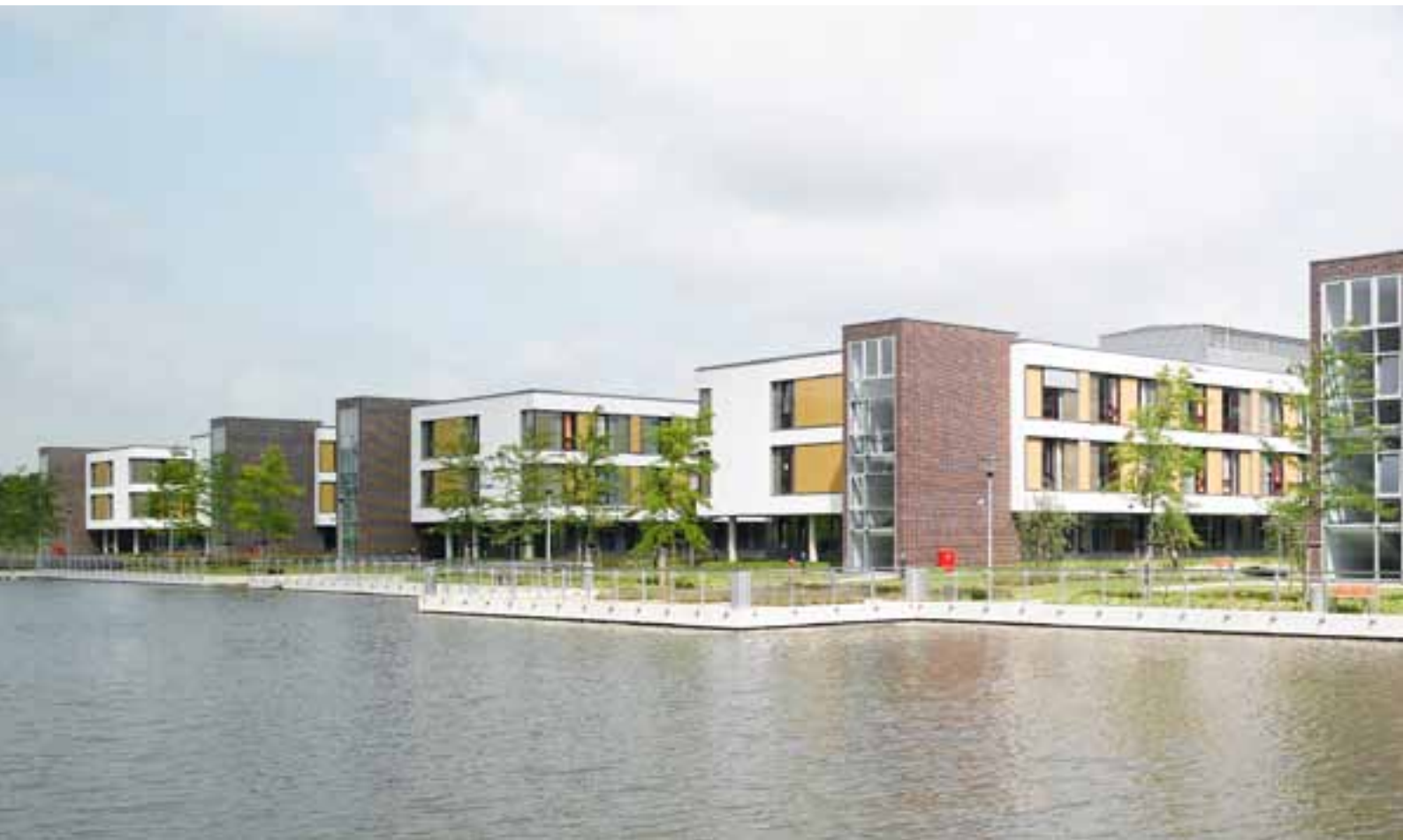
Johannes Wesling Klinikum in Minden mit Hörmann Produkten