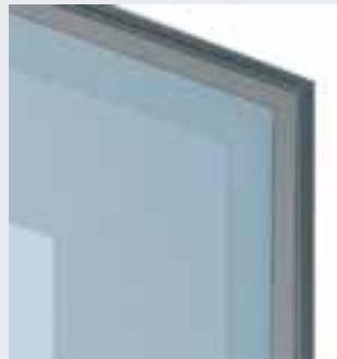
Flächenbündige Verglasung auf Zargenspiegel mit Z-Winkel Glashalteleiste (nur bei 1-teiliger Zargenausführung, auch beidseitig erhältlich)