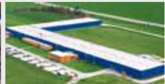
Hörmann Legnica Sp. z o.o., Polen