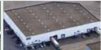
Hörmann Flexon, Leetsdale PA, USA

Als einziger Hersteller auf dem internationalen Markt bietet die Hörmann Gruppe alle wichtigen Bauelemente aus einer Hand. Sie werden in hochspezialisierten Werken nach dem neuesten Stand der Technik gefertigt. Durch das flächendeckende Vertriebs- und Servicenetz in Europa und die Präsenz in Amerika und China ist Hörmann Ihr starker, internationaler Partner für hochwertige Bauelemente. In einer Qualität ohne Kompromisse.