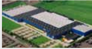
Hörmann KG Brandis, Deutschland