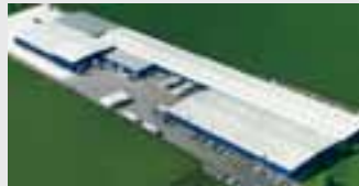
Hörmann LLC, Montgomery IL, USA