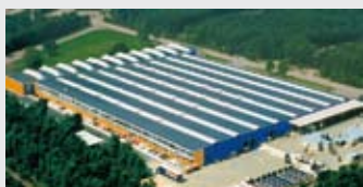
Hörmann Genk NV, Бельгия