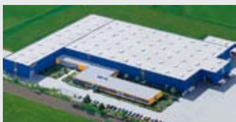
Hörmann KG Dissen, Германия