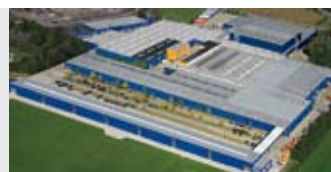
Hörmann KG Brockhagen, Германия