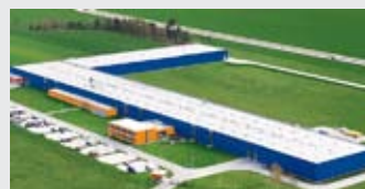
Hörmann Legnica Sp. z o.o., Польша