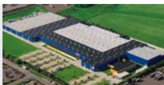
Hörmann KG Brandis, Германия