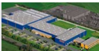
Hörmann KG Antriebstechnik, Германия