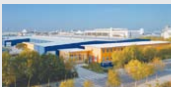
Hörmann Beijing, Китай