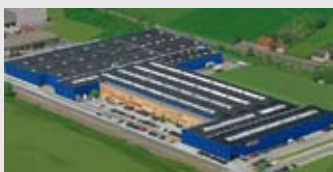
Hörmann KG Werne, Германия