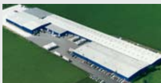
Hörmann LLC, Montgomery IL, США