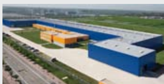
Hörmann Tianjin, Китай