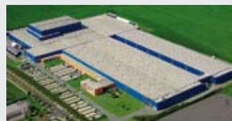
Hörmann KG Ichtershhausen, Германия