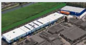
Hörmann Alkmaar B.V., Нидерланды