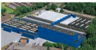
Hörmann KG Amshausen, Германия