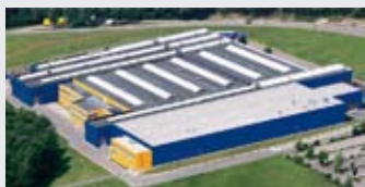
Hörmann KG Eckelhausen, Германия