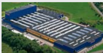
Hörmann KG Freisen, Германия